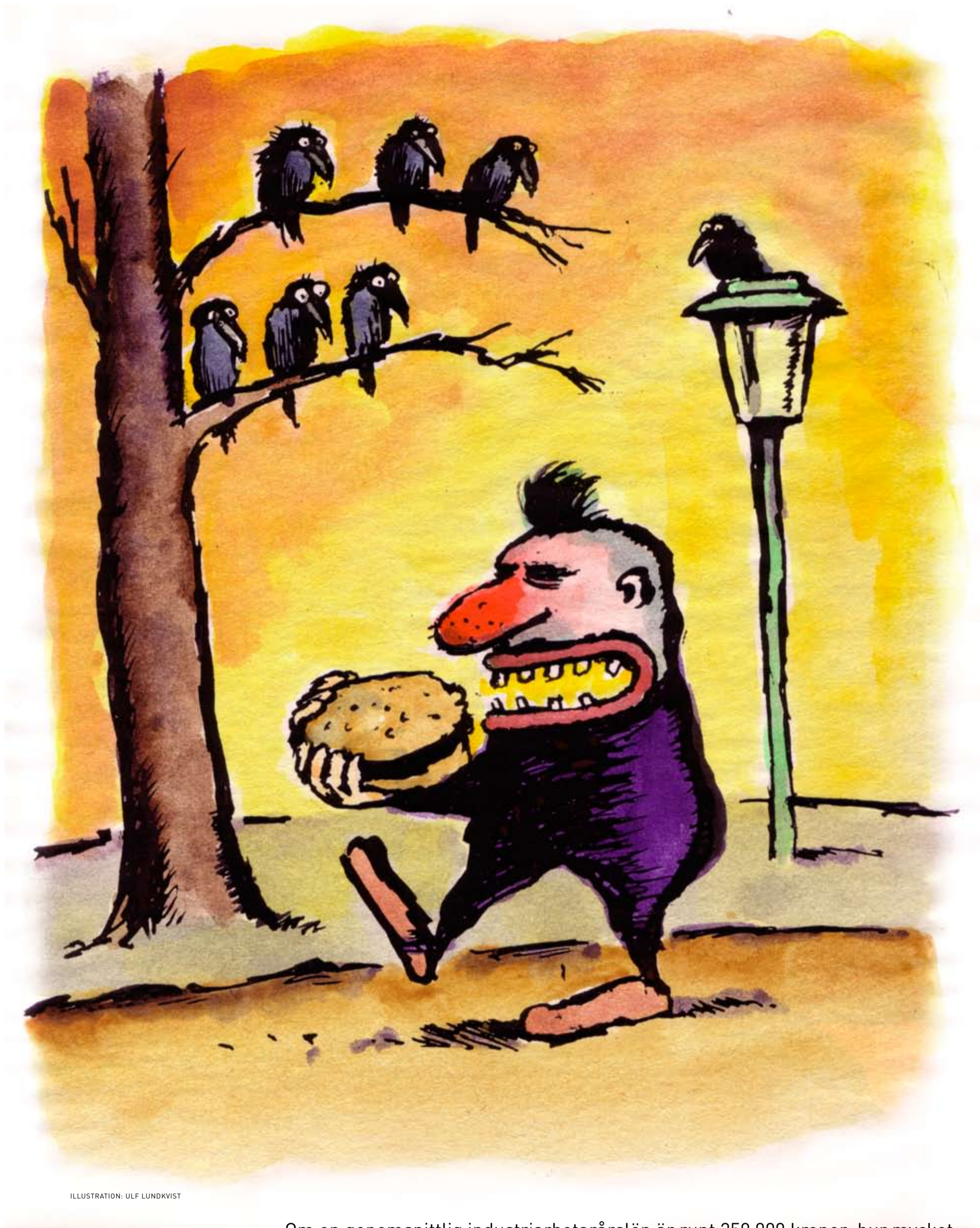
ILLUSTRATION: ULF LUNDKVIST

Om en genomsnittlig industriarbetarårslön är runt 250 000 kronor, hur mycket tjänar då en vd? LO granskade 50 stycken i våra största börsbolag. Genomsnittlig inkomst: Åtta miljoner kronor. Nästan 32 gånger mer än en vanlig löntagare.