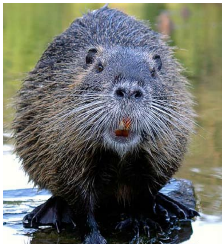
Maud Olofsson vill att vi ska bli bävvar.

Hon tänker så här: Företagen minskar sin risk samtidigt som unga får ”framtidstro”, erfarenhet och goda möjligheter att